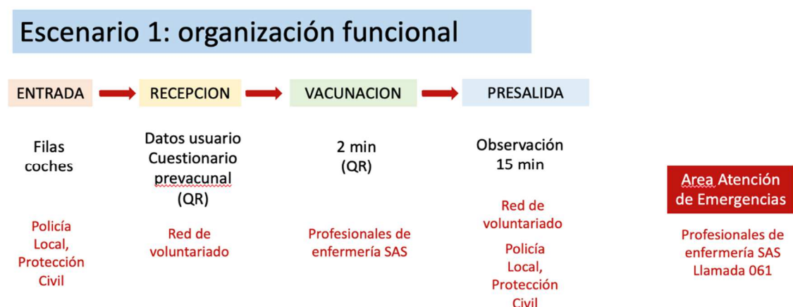
Figura 1. Organización funcional esquemática del Escenario 1