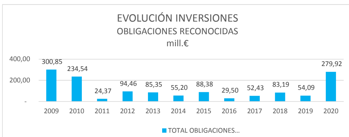
CUADRO EJECUCIÓN CAPÍTULO VI SAS 2009-2020

Esta prolongada disminución de la inversión se ha manifestado en unas carencias muy significativas en las infraestructuras sanitarias andaluzas y en los equipamientos de los distintos centros sanitarios. Construcción de centros sanitarios previstos, que no se han construido; ampliaciones y reformas de los ya existentes, que no se han realizado; falta de reposición de dispositivos médicos que han provocado un alto nivel de obsolescencia; todo esto había tenido como consecuencia un sistema sanitario público con una evidente necesidad de mejora y adaptación a las necesidades que merecen los profesionales sanitarios y la sociedad andaluza.