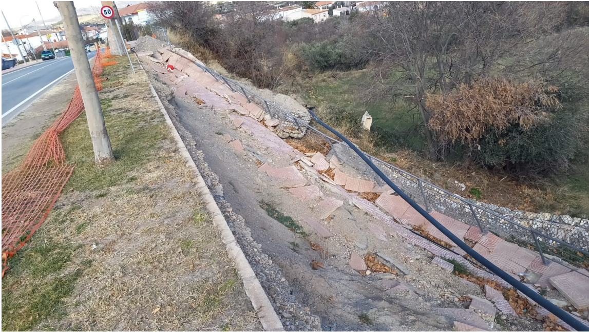
Detalle de los gaviones derrumbados y la acera y servicios destruidos.