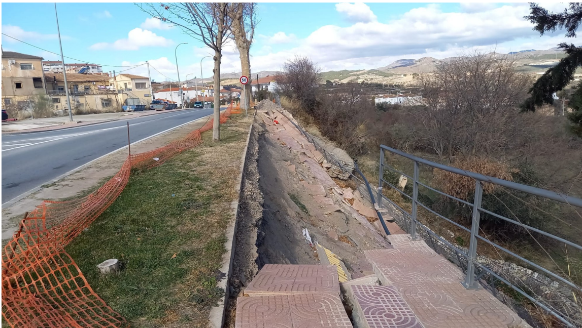
Muro de gaviones derrumbado y acera destruida