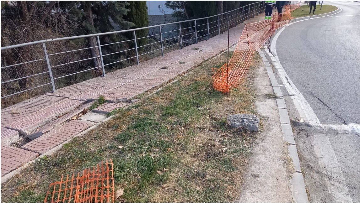
Acera a demoler para prolongar la escollera, incluso retirada de pinos y vegetación del talud