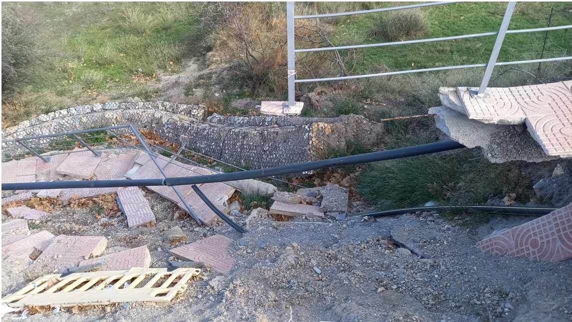
Detalle de los gaviones derrumbados y la acera y servicios destruidos.