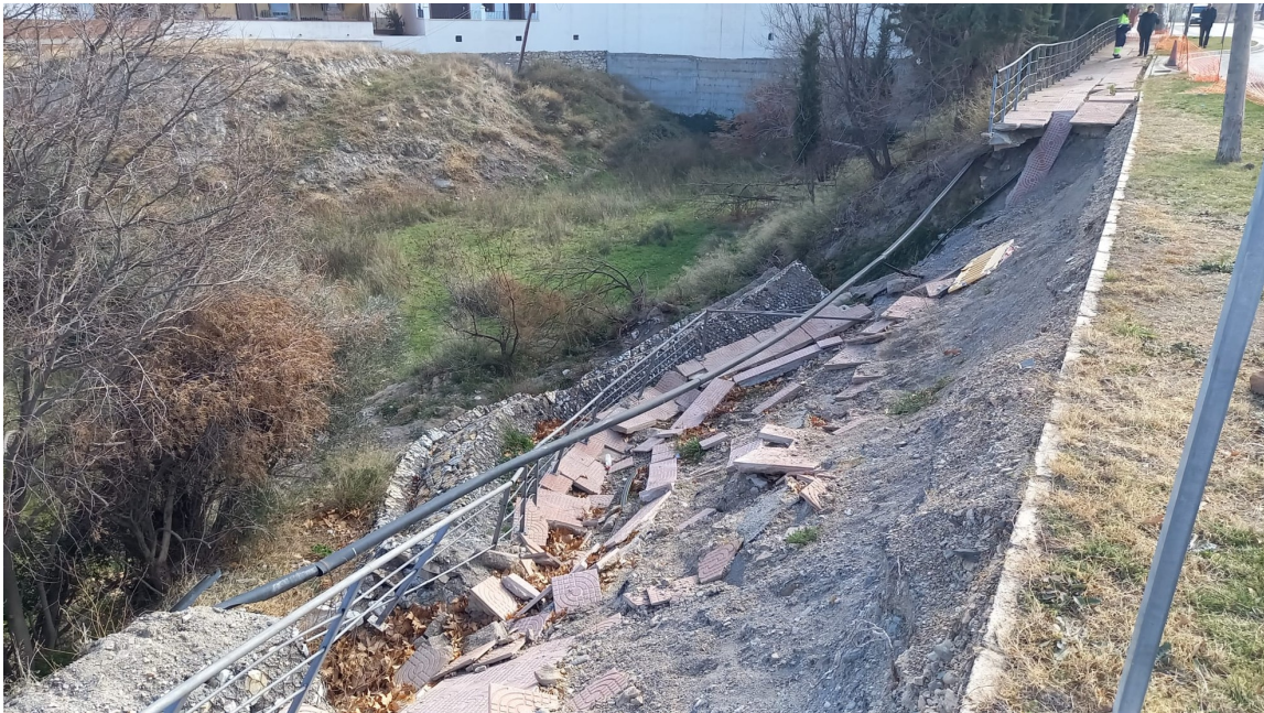
Detalle de los gaviones derrumbados y la acera y servicios destruidos.